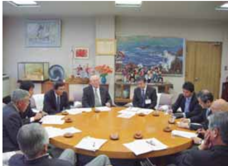
回答書受け取り後、岡崎市長ほか市幹部と意見交換

高知市農業委員会では、これらの回答に対する評価をし、移動農業委員会等で出された意見・要望をふまえ、本市農業に関する事項を検討してまいりました。 10月20日には、「平成22年度における農業施策並びに農業予算に関する建議」を実施することになっています。